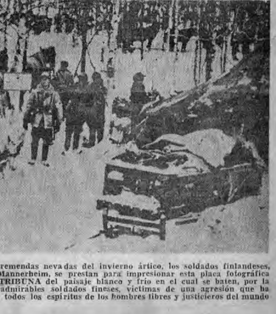
EN EL BOSQUE helado por las tremendas nevadas del invierno ártico, los soldados finlandeses, en algún sitio de la famosa línea Mannerheim, se prestan para impresionar esta placa fotográfica que da idea a los lectores de LA TRIBUNA del paisaje blanco y frío en el cual se batieron por la independencia de su patria, los admirables soldados fineses, víctimas de una agresión que ha levantado en contra del asaltante todos los espíritus de los hombres libres y justicieros del mundo